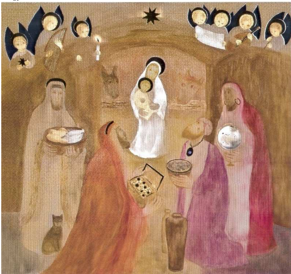
UDVARDI ERZSÉBET KOSSUTH-DÍJAS FESTŐMŰVÉSZ ALKOTÁSA