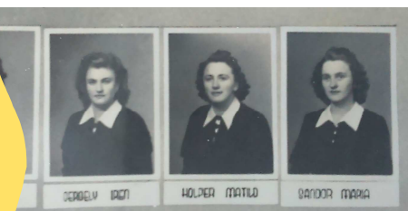
Az 1944-es tablókép