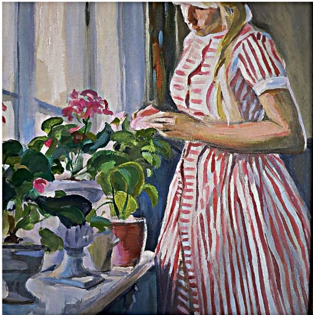
Torjay Valter: Virág gondozás (részlet) - olaj/vászon - 2009.