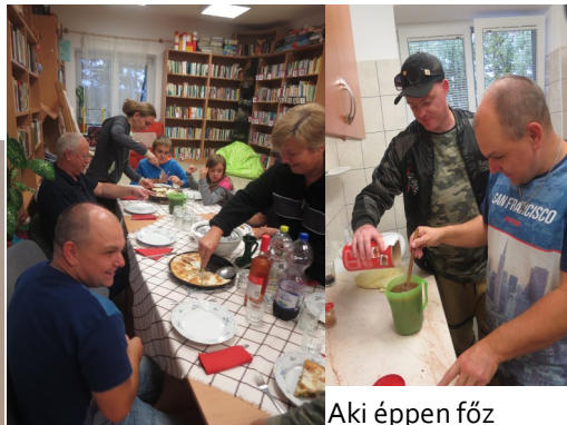
Aki éppen főz